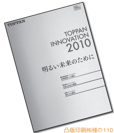
凸版印刷(株)様の110年史

従来の社史は、ハードカバーの豪華装丁本が多く、応接室に置く飾り物となっていました。これに対して「簡易型社史・年史」は、会社の歴史を必要最小限にまとめ、ソフトカバーのハンディサイズとすることで制作費を大幅に削減。社員全員に配布することができ、新たな社内向けコミュニケーション・ツールとして威力を発揮します。