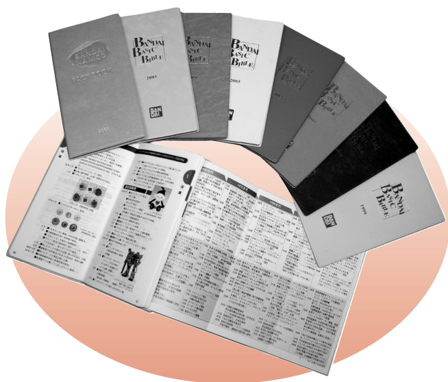
弊社が1994年以来、毎年制作している(株)バンダイナムコホールディングス様のファクトブック

業界各社の業績、市場推移、専門用語、年間の出来事など、関連する業界の各種情報を網羅することで、業界をウォッチングしている新聞記者や証券アナリストらの利用価値を高め、リーディングカンパニーであることを印象づめます。