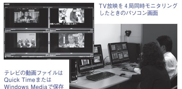
テレビの動画ファイルは Quick Time または Windows Media で保存

地上デジタル放送受信技術と映像圧縮技術を応用し、1台のパソコンで負担なく、しかも低価格でNHKや在京キー局を同時に録画・モニタリングできる簡易式TVモニターシステムを開発し、報道分析に活用しています。そのほか、ご要望に応じてWebサイトなどにも対応します。